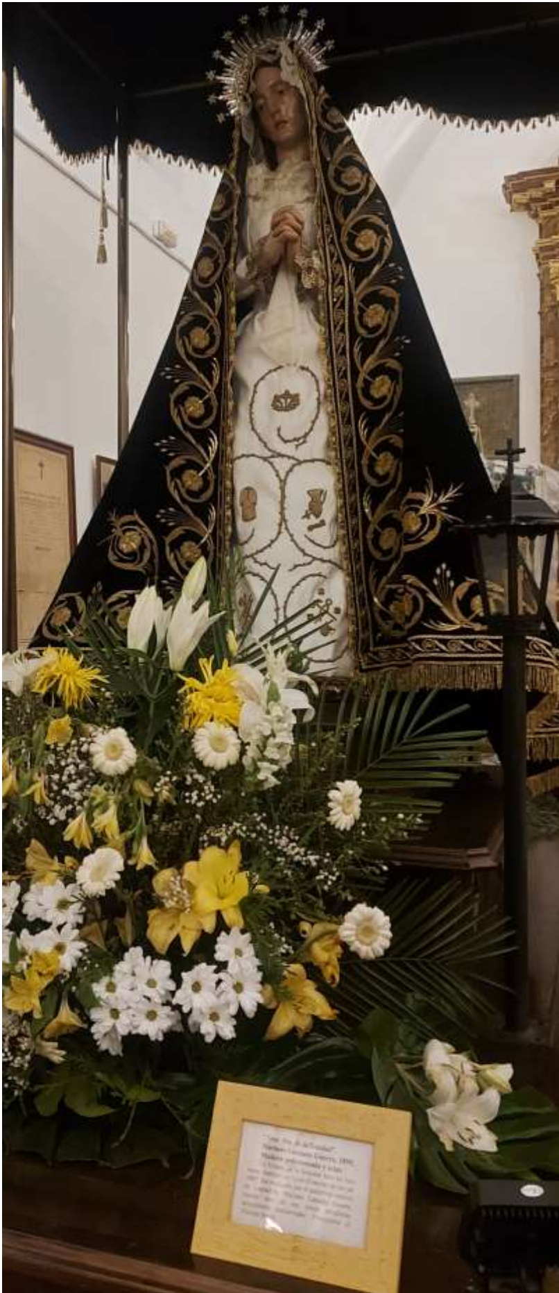
Paso de la Virgen de la Soledad.