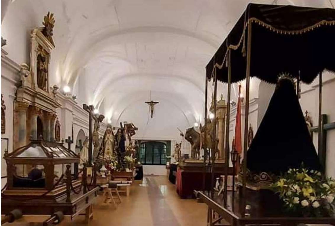
Visión general de la primera sala del museo (antigua ermita).