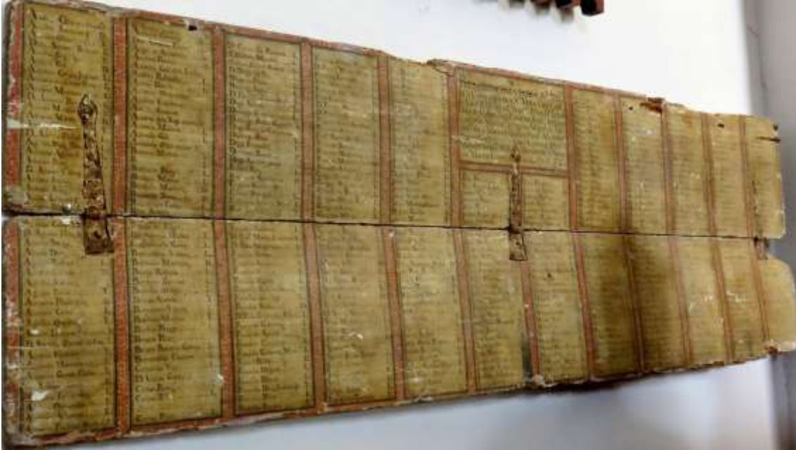
Tabla de hermanos de 1774.