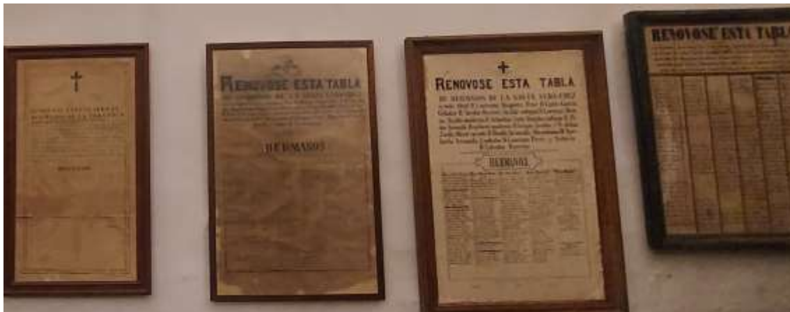
Varias tablas de hermanos de la Cofradía 1921, 1911, 1901 y 1866.