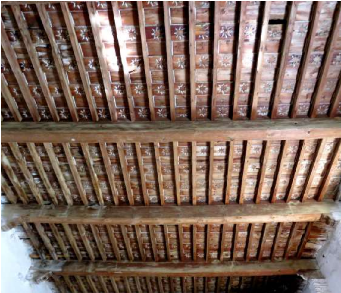
Artesonado mudéjar del siglo XVI de la segunda sala del museo.