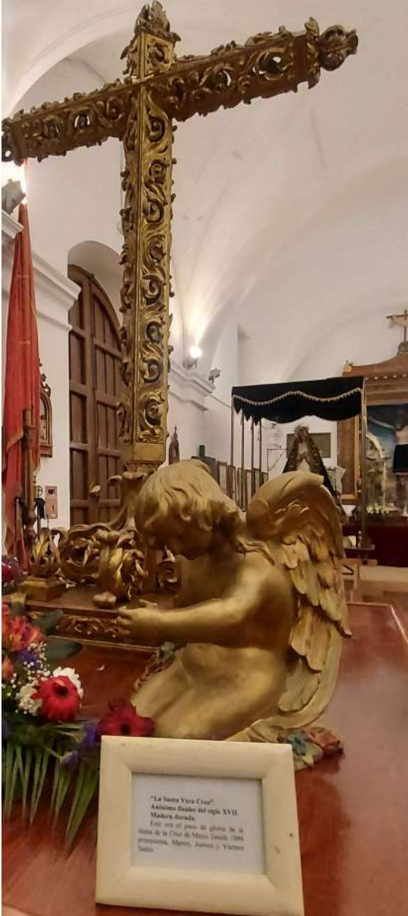
Paso de la Santa Vera Cruz.

"La Santa Vera Cruz" Anticmo Escudo del siglo XVII. Madera dorada. Este era el paso de gloria de la Santa de la Cruz de María Inmaculada (1999) proveniente, Alarcón, Jarama y Viana Santia