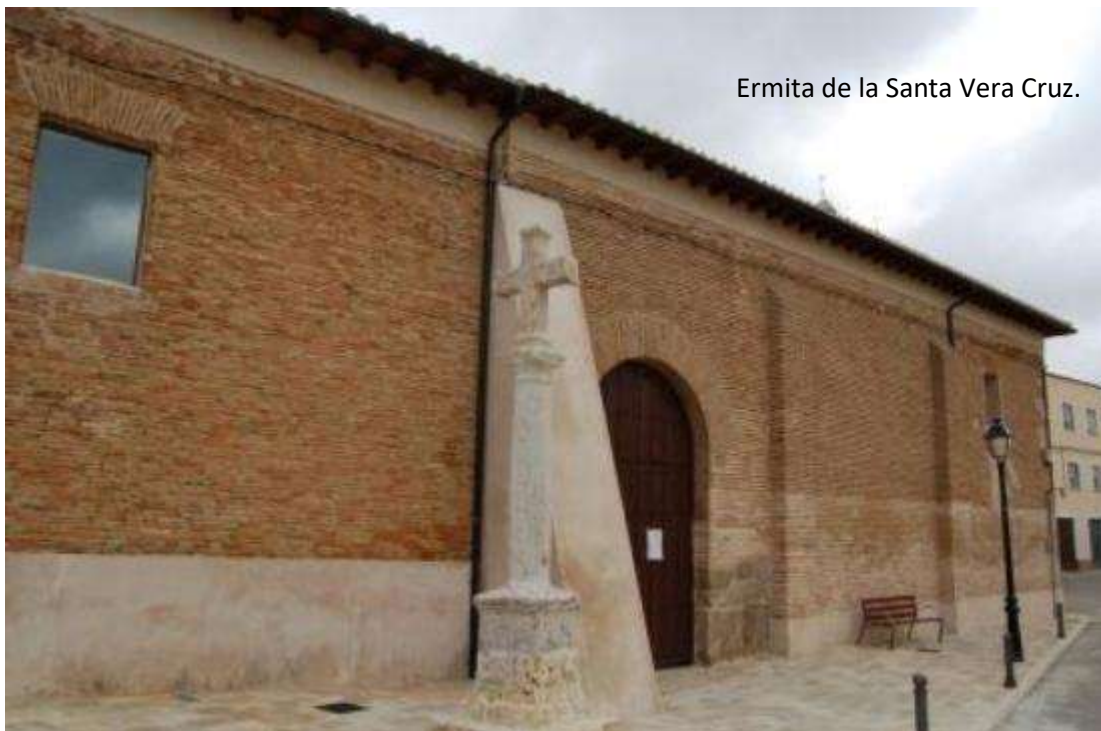
Ermita de la Santa Vera Cruz.