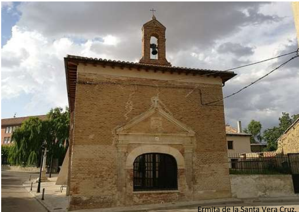
Ermita de la Santa Vera Cruz.