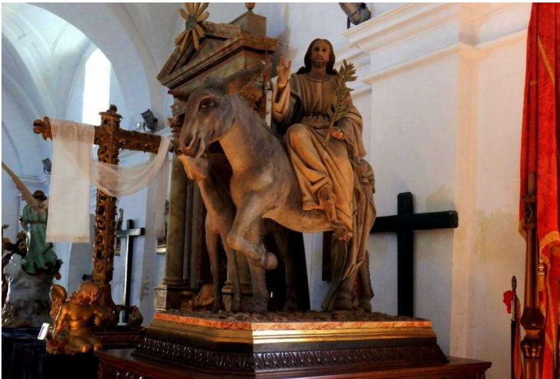
Paso de la Entrada Triunfal de Jesús en Jerusalén, “la Borriquilla”, en primer término y Paso de la Santa Vera Cruz en segundo término.