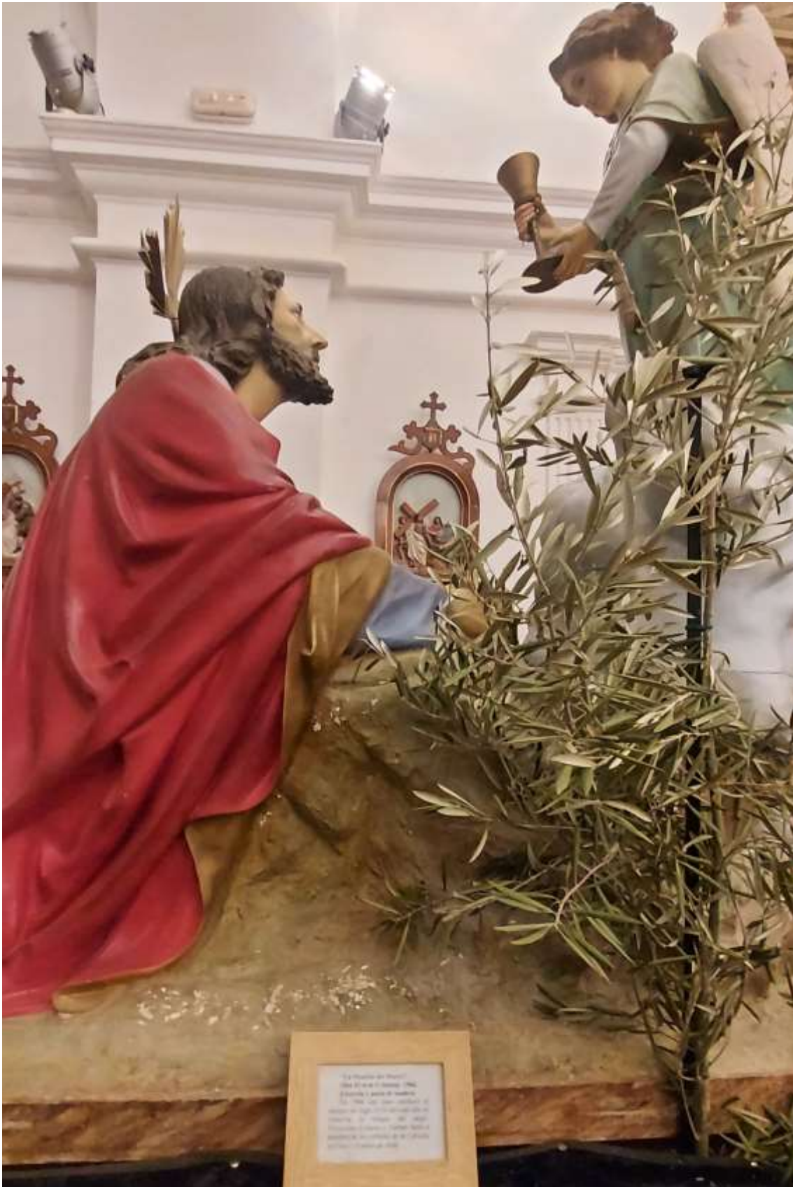
Paso de la Oración del Huerto.