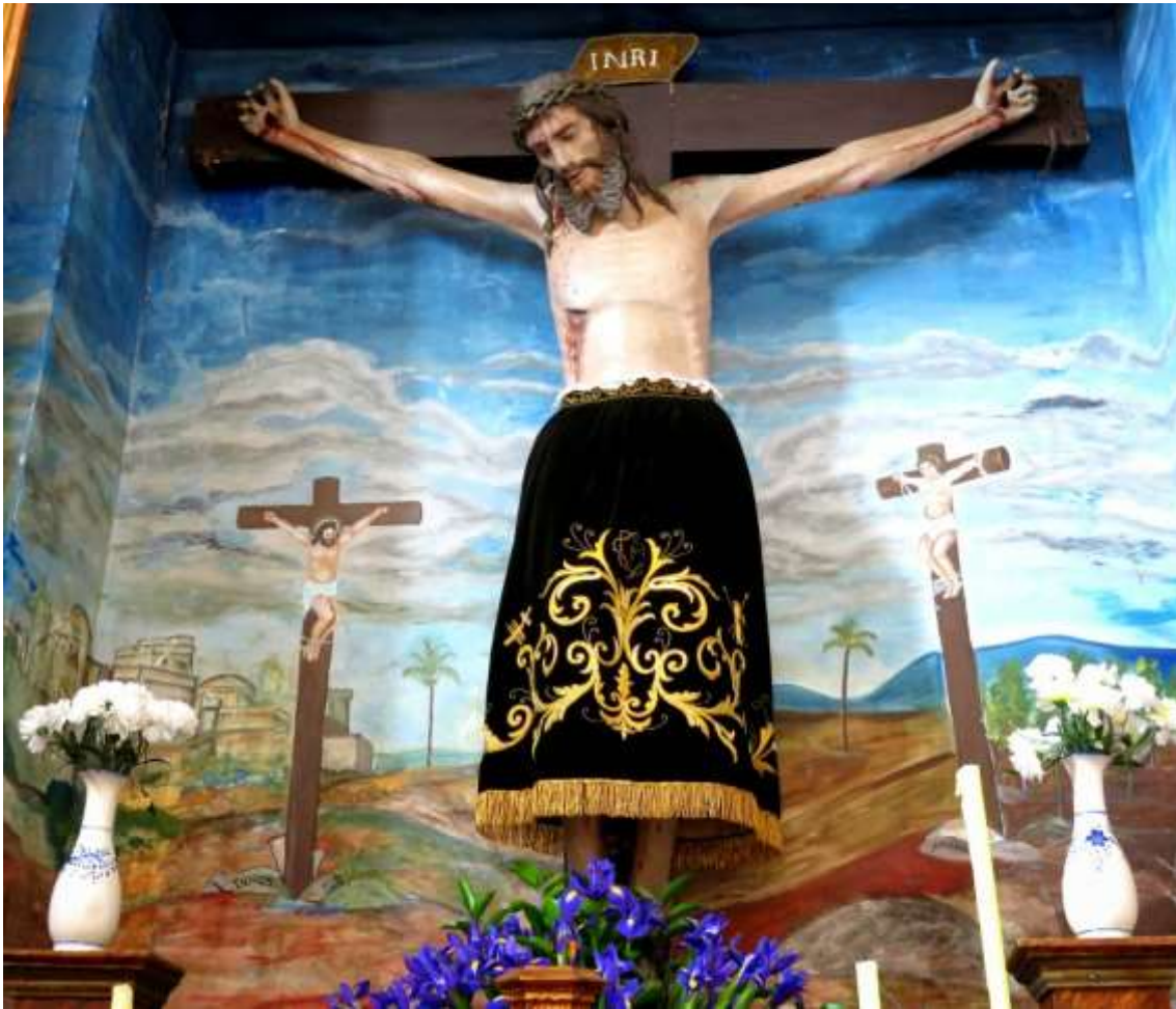
Santo Cristo de la Cruz. Anónimo mexicano. 1562.